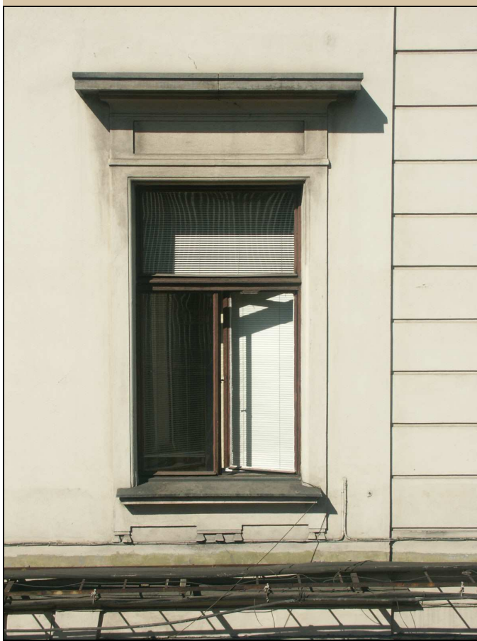
celkový pohled z exteriéru