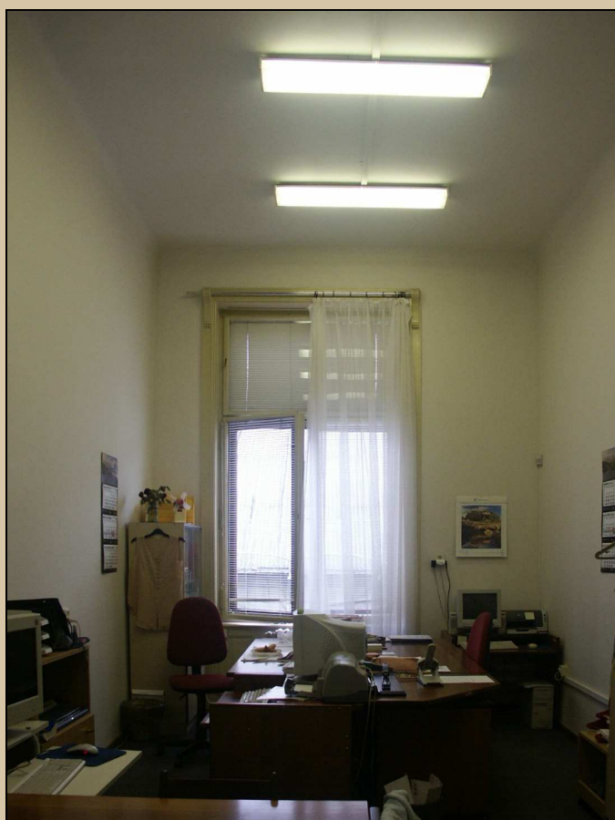
celkový pohled z interiéru