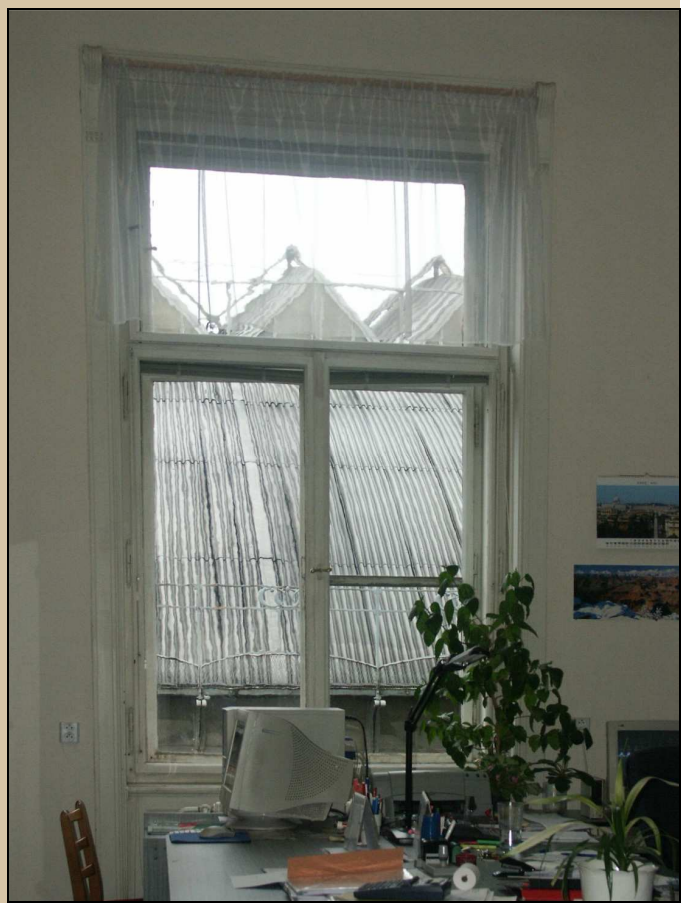
celkový pohled z interiéru