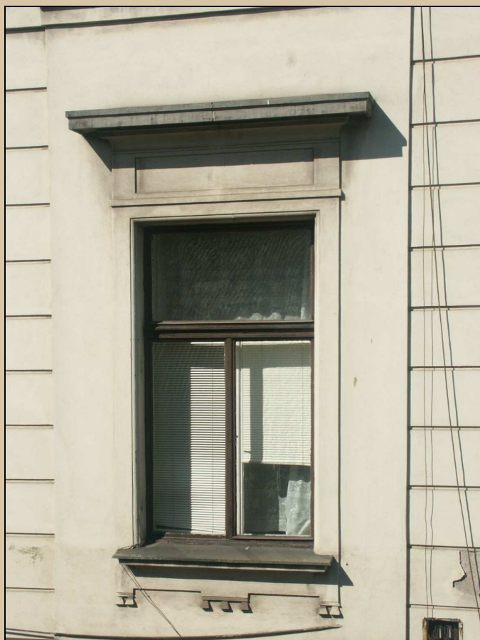
celkový pohled z exteriéru